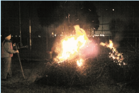
23/3/17: ROGO DELLA VECCHIA