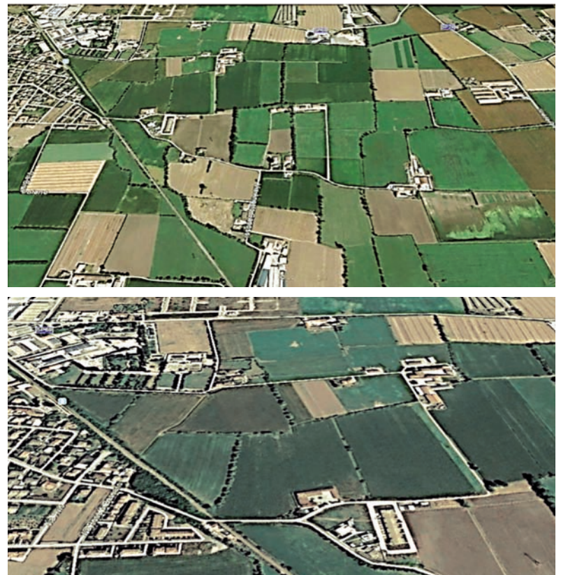
Immagine due: visione ristretta dell'area precedente (che era di pertinenza di quell'antico paese). Trattasi, a mio avviso, proprio del perimetro di quel paese (tra: Bredelle a nord, cascina Maggia a est, zona Mercadèi a ovest, San Zeno a sud). Tale perimetro è peraltro ancora quasi interamente percorribile su strada (a tratti asfaltata, a tratti bianca).

Immagine uno: l'area della mia indagine, a est del paese, facendo all'incirca punto di riferimento con: strada per Carpendolo a nord; attuale villaggio Longobardi a ovest; Brancoleno a sud; cascina Palina - strada provinciale Montichiari-Visano a est (dalla rotonda in avanti). Si notino, tra l'altro, il ben dettagliato reticolo dei campi, con identico orientamento, e le linee dei percorsi viari che ci fanno intuire... anche ciò che oggi più non c'è in quanto arato, o "distratto" dalla sua funzione originale.