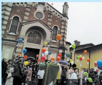
5/2/17: GIORNATA DELLA VITA