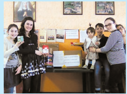
7/4/17: RACCOLTA ALIMENTARE CONSEGNATA E SISTEMATA ALLA CARITAS DAI NOSTRI BAMBINI