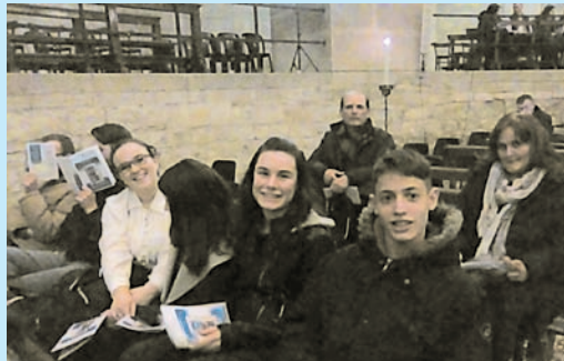
16/3/17: SCUOLA DELLA PAROLA CON IL VESCOVO MONARI