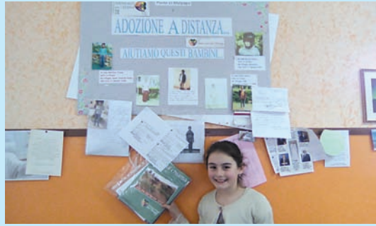
ARRIVO DELLE LETTERE DAI BAMBINI ADOTTATI A DISTANZA