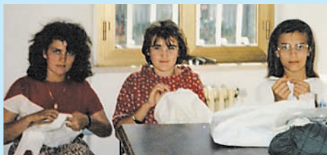
IERI '80 CUCITO E LAVORETTI