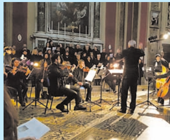
12/2/17: CORO DI MALPAGA