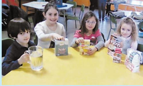
GLI IMPEGNI QUARESIMALI