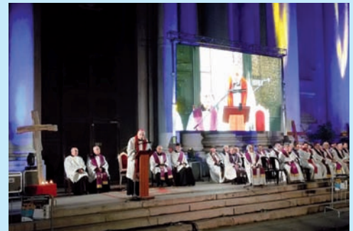
8/4/17: VEGLIA DELLE PALME BS