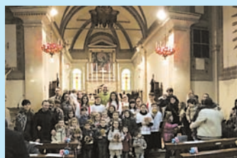
5/2/17: GIOVANI FAMIGLIE