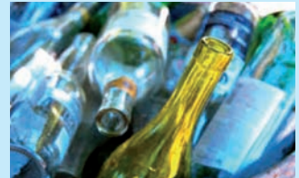
IN ORATORIO RACCOLTA FERRO, ALLUMINIO, VETRO PER GLI AMICI DEL SIDAMO DI CALVISANO CHE OSPITEREMO A PRANZO IN ORATORIO A FINE APRILE