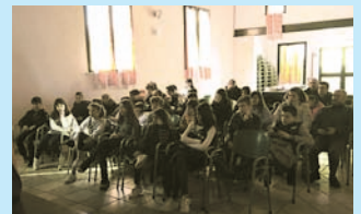
12/3/17: RITIRO QUARESIMALE ICFR6