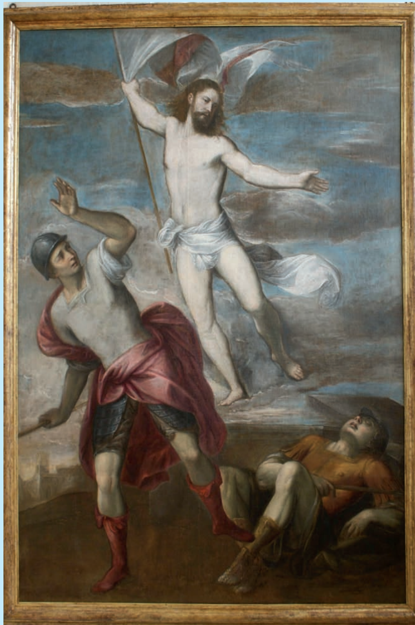
TELA RAFFIGURANTE "RESURREZIONE DI CRISTO" AUTORE IGNOTO XVII SEC. OPERA SITA NELLA CHIESA