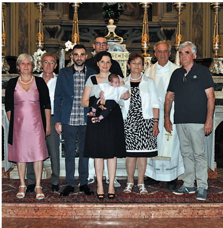
Battesimo del 30 giugno 2013.