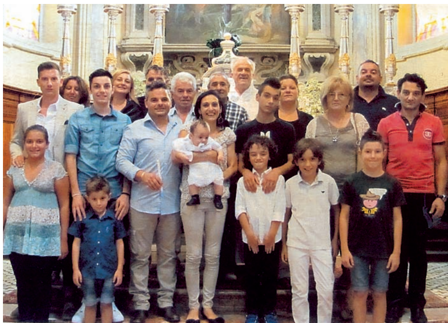
Battesimo del 25 agosto 2013.