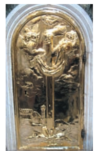
Foto 10 = bellissimo portale del tabernacolo dell'altare: una croce "vestita" da un drappo si erge davanti ad un paese, con evidenza al torrione-potere civile e al campanile ecclesiale (potrebbe trattarsi del nostro paese?), con putti ad osservare dall'alto.