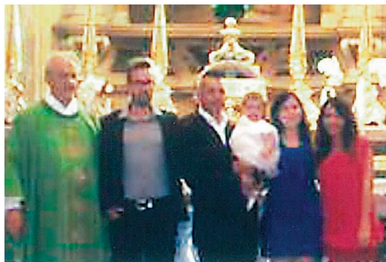
Battesimo del 30 giugno 2013.